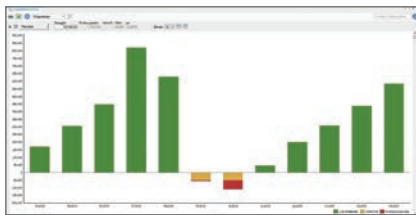
Liquiditätsvorschau mit Planwerten

Stammdaten können auf Basis diverser Standardkontenrahmen branchenbezogen per Import angelegt werden. Die Anlage eines neuen Controlling-Projekts erfolgt mit wenigen Schritten anhand eines automatisierten Vorgangs. Die ersten Auswertungen bis zur monatlichen Liquiditätsvorschau sind mit wenigen Klicks erstellt.