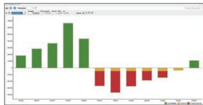
... und mit negativer Prognose

Durch vielseitige Konfigurations-Möglichkeiten kann die langfristige Liquiditätsvorschau als Frühwarnsystem oder für Investitionsplanungen verwendet werden.